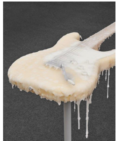
III.2 Charbel-joseph H. Boutros, Waxed Melody, 2022, photo : graysc et Charbel-joseph H. Boutros