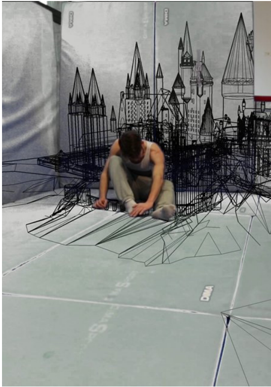
Yvain, mout for oublians , image extraite de la vidéo, Eric Giraudet, 2018