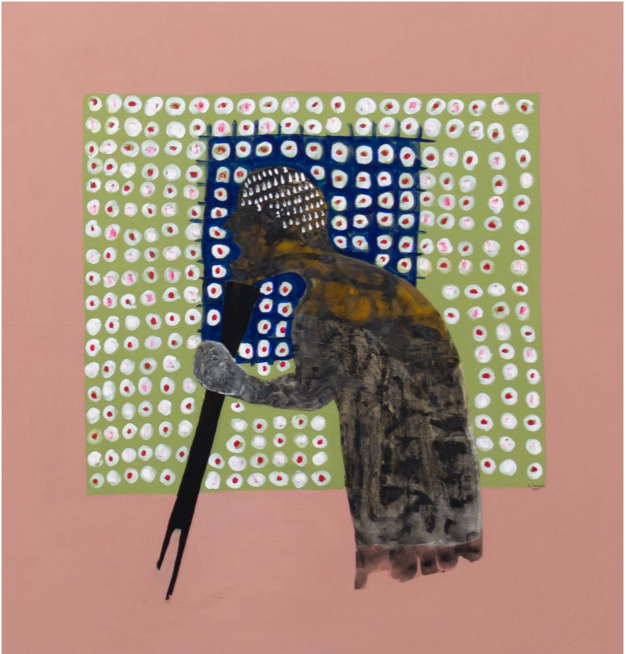
Amadou Sanogo, Mes observations face à la situation (l'arrivée du Covid-19, Rennes), mars 2020 162 × 150 cm, acrylic on canvas production: La Criée centre d'art contemporain