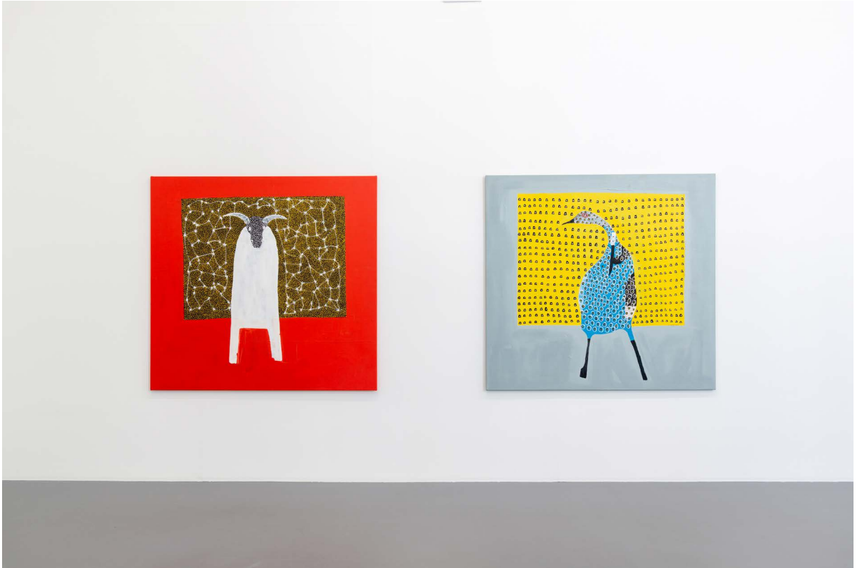
Amadou Sanogo, exhibition view Verbs and proverbs , La Criée centre d'art contemporain, 2020 production: La Criée centre d'art contemporain