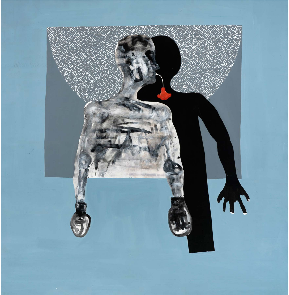
Amadou Sanogo, Akaguelé məkəni kənkə kələ . ( Il est difficile de se battre contre soi-même ), 2020 164 x 160 cm, acrylic on canvas production: La Criée centre d'art contemporain