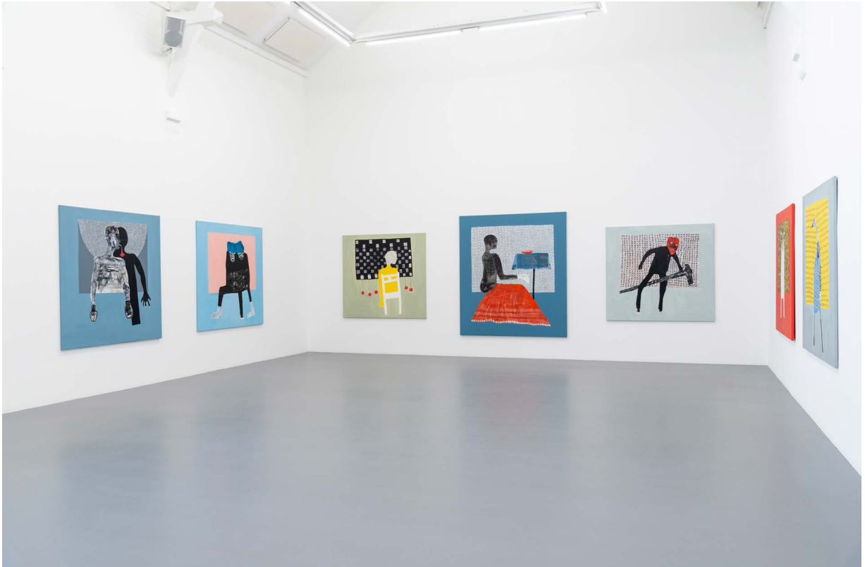
Amadou Sanogo, exhibition view Verbs and proverbs , La Criée centre d'art contemporain, 2020 production: La Criée centre d'art contemporain