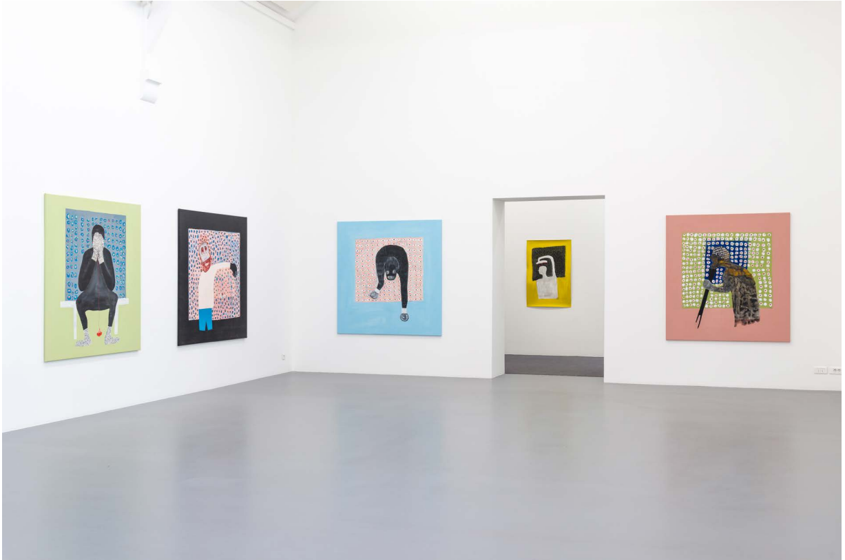
Amadou Sanogo, exhibition view Verbs and proverbs , La Criée centre d'art contemporain, 2020 production: La Criée centre d'art contemporain