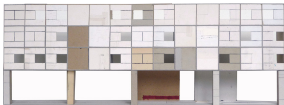
Scuola Elementare , 2008 [École élémentaire] crayon et aquarelle sur carton et papier