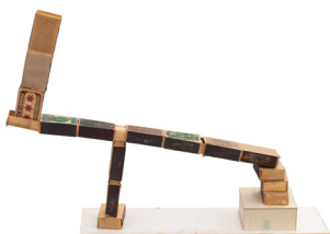
Nattsömmen , 2015 [Une nuit de sommeil] crayon et graphite sur boîtes d'allumettes, carton et papier

pour toutes ces sculptures : courtesy de l'artiste et de Galleri Magnus Karlsson, Stockholm