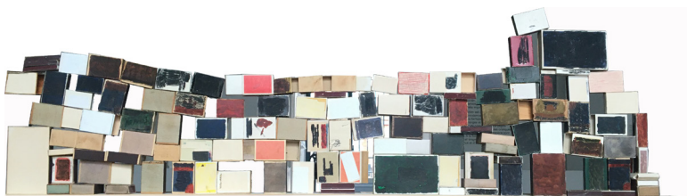
Bak rigel och bås , 2012 [Derrière des serrures et des barreaux] crayon et aquarelle sur boîtes d'allumettes, carton et papier