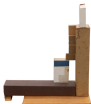
Kostym (Costume) , 2010 [Costume] graphite et aquarelle sur papier et carton