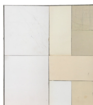
Kapitel 3 , 2018 [Chapitre 3] graphite sur carton et papier