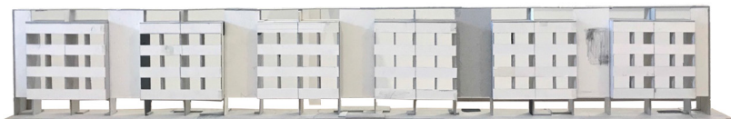
Wer nur den lieben , 2020 [Qui n'est qu'amour] graphite sur carton